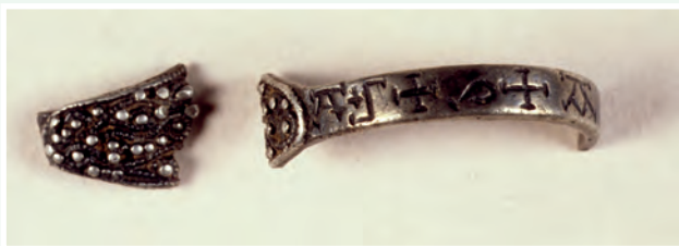
Fáinne méire inscríofa meánaoiseach.

Sula n-eisítear cead do dhuine chun brathadóir miotail a úsáid, beidh ar an t-iarrthóir a shoiléiriú go bhfuil úsáid an ghairis de réir an dea-chleachtas seandálaíochta. Baintear amach é seo trí ráiteas modha mionsonraithe a chur isteach ina leagtar amach an clár oibre beartaithe chun measúnú a dhéanamh ar shuíomh agus chun an leibhéal eolais seandálaíochta is mó agus is féidir a bhaint ón obair a dhéanfar.