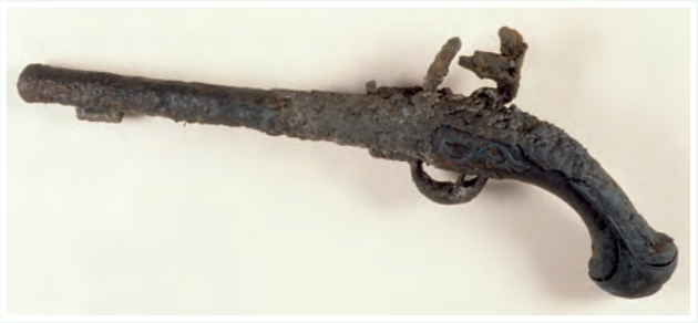
Piostal oifigigh 1700-1750. Seans gur ar láthair troda a aimseofaí rud mar seo.