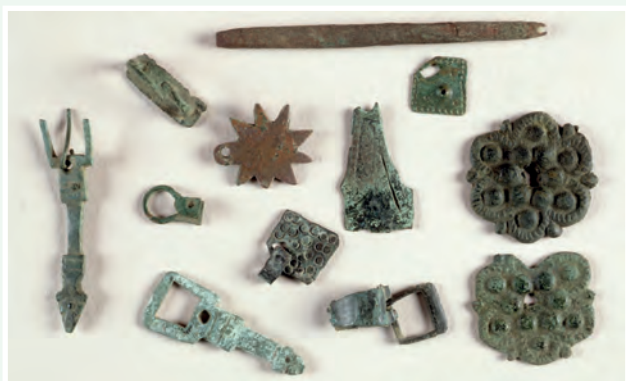
Feistí úma, búclai agus pionna cláirsí ón meánaois. Seo na cineálacha rudaí ársa a aimsítear le brathadóirí miotail.

Ní féidir le cuardaigh randamacha le brathadóirí miotail a dhéanamh amach an bhfuil tábhacht seandálaíochta leis an rud a aimsíodh nó an rud é a caitheadh amach le déanaí. Is é an toradh a bhíonn air i gcás ar bith go suaitear an ithir nó an áit timpeall ar an mír a aimsíodh agus scriostar aon fhianaise nó mír neamh-mhiotalacha.