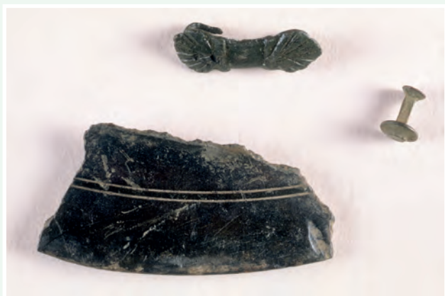
Feiste creasa meánaoiseach le maisiú muirín, cuid de shoitheach agus seam báid níos nuai.

Féadfaidh aon duine a úsáideann brathadóir miotail chun na srianta thuas a shárú agus, tar éis rud ársa a aimsiú, a thochlaíonn chun an mhír a fháil gan ceadúnas tochailte, a bheith ciontach i gcion faoi Achtanna na Séadchomharthaí Náisiúnta.