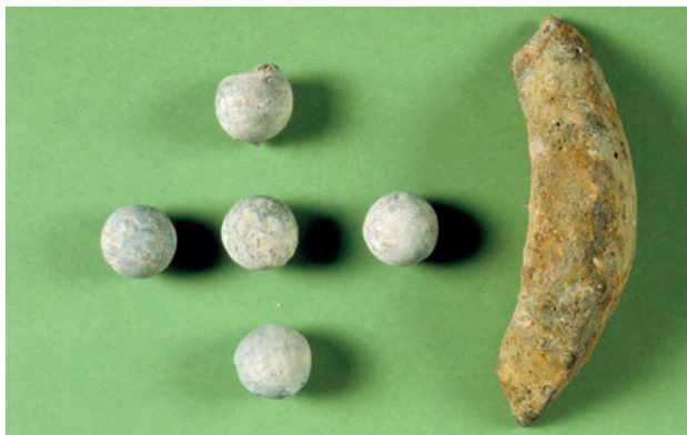
Liathróidí muscaeid agus cuid de bhuama moirtéir ó láthair chatha ón 17ú haois.

Sainaitnítear suíomhanna na séadchomharthaí taifeadta ar shuíomh gréasáin na Seirbhíse Séadchomharthaí Náisiúnta de chuid an Roinn Ealaíon, Oidhreachta agus Gaeltachta www.archaeology.ie .