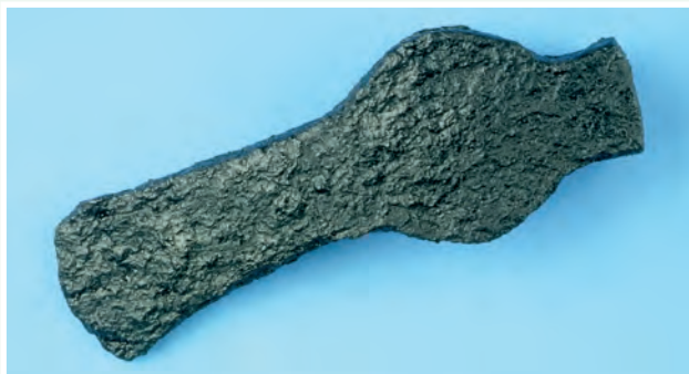
Tua iarainn meánaoiseach.