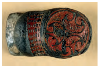
Píosa deiridh cruanta de bhráisléad ón luath-meánaois tar éis é a chaomhnú.

Tá sé i gceist go n-úsáidfear an cháipéis seo mar threoir ghinearálta le forálacha Achtanna na Séadchomharthaí Náisiúnta a bhaineann le brathadóirí miotail agus nach léirmhíniú dleathach ar na hAchtanna sin í. Tá téacs iomlán d'Achtanna na Séadchomharthaí Náisiúnta 1930–2004, agus reachtaíocht eile a d'fhéadfadh a bheith infheidhmithe, ar fáil ag www.irishstatutebook.ie .